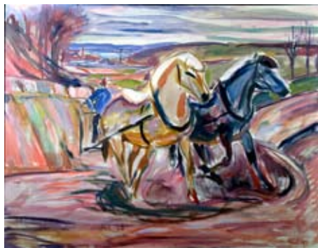
[ Vårpløying ]