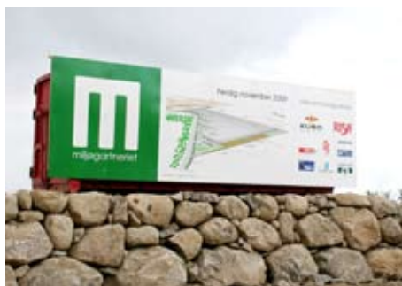
[ Informasjonsskilt for Miljøgarteriet, Nordens største gartneri på 77 000 m 2 under ett tak. ]

NetPrint kan nå levere skilter i alle størrelser og kvaliteter til inne og ute bruk. Skiltene kan leveres basert på standardmoduler fra vårt produktsortiment eller skreddersys til