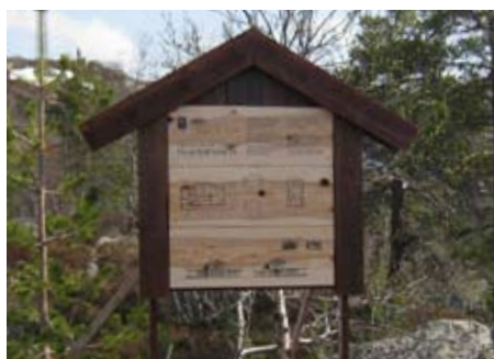
[ Unike byggeplasskilt for hver hytte, plottet direkte på høvlet materiale for Sinneshyttå ]

kundes spesifikke behov. Disse produseres med moderne produksjonsteknikker innen flatbedplottning, fresing, vakumforming og folie. NetPrint har inngått samarbeid med Nordens største leverandør innen plast, og