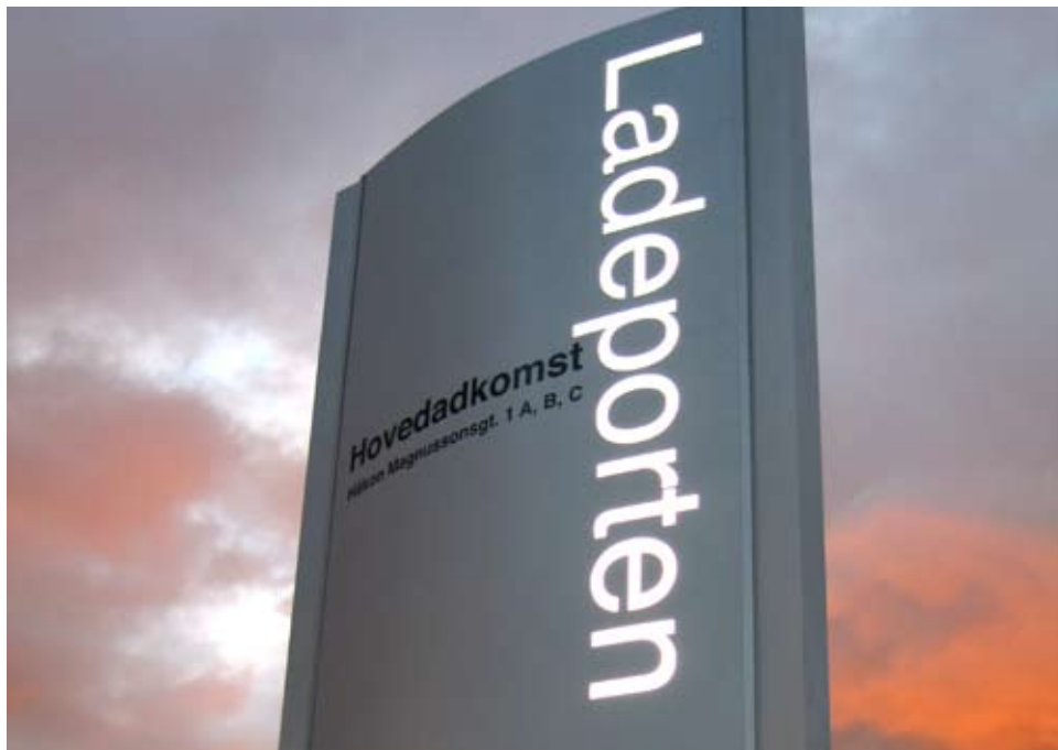
[ Ladeporten ]

kundes spesifikke behov. Disse produseres med moderne produksjonsteknikker innen flatbedplottning, fresing, vakumforming og folie. NetPrint har inngått samarbeid med Nordens største leverandør innen plast, og