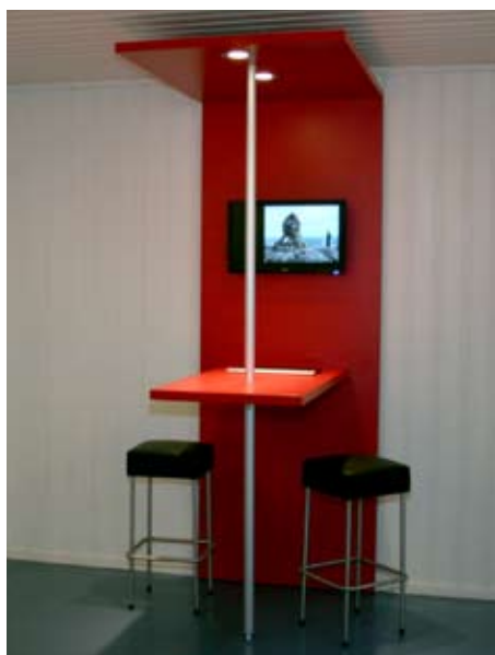
[ Barløsningen i NetPrints nye butikkonsept ]